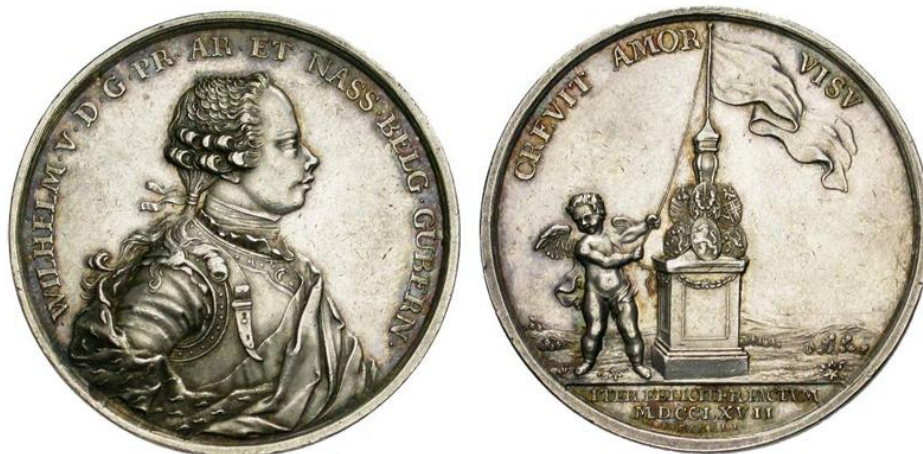
Afb. 4: Penning t.g.v. de verloving van stadhouder Willem V met Wilhelmina van Pruisen (1767).

Hij onderhield nauwe contacten met zijn familie in onze stad en hij leverde de stempels voor de zilveren en gouden penningen van 's-Hertogenbosch.