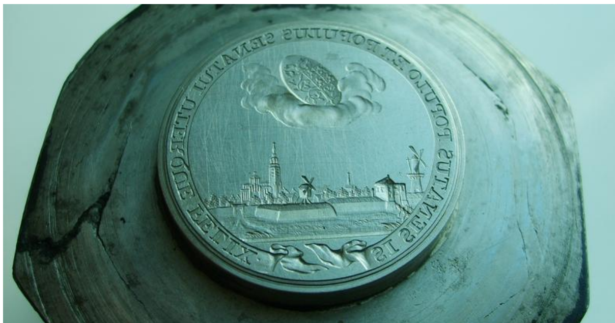
Afb. 11: Keerzijde van de stempel uit 1785 gemaakt door Th. Victor van Berckel (collectie Koninklijke Munt België).

Lei Lennaerts 's-Hertogenbosch 16 augustus 2008