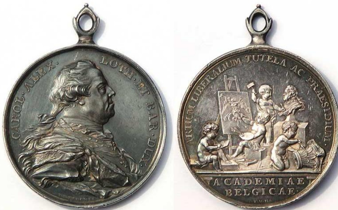
Afb. 5: Prijsmedaille voor de Brusselse Academie des beaux arts uit 1788 met het portret van de landvoogd van de Oostenrijkse Nederlanden, hertog Karel van Lotharingen.