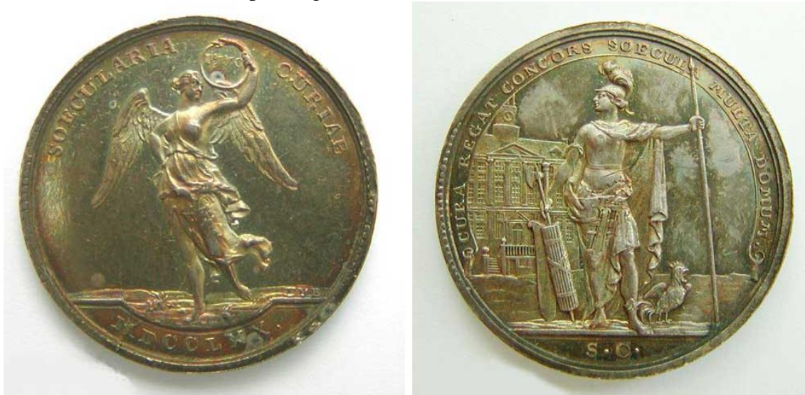
Afb. 7: De stadhuispuntenning van 1770.

Op een aantal van deze penningen komt daadwerkelijk een afbeelding van het Bossche stadhuis voor. In 1770 was het honderd jaar geleden dat de oude middeleeuwse gevel van het stadhuis werd vervangen door de gevel zoals wij die vandaag nog zien. Dit was reden tot het slaan van een nieuwe stadhuispuntenning. (afb. 7).