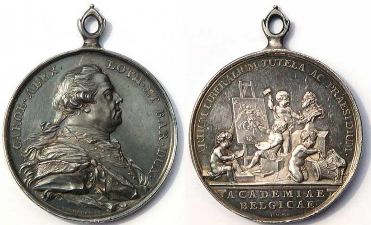
Afb. 5: Prijsmedaille voor de Brusselse Academie des beaux arts uit 1788 met het portret van de landvoogd van de Oostenrijkse Nederlanden, hertog Karel van Lotharingen.