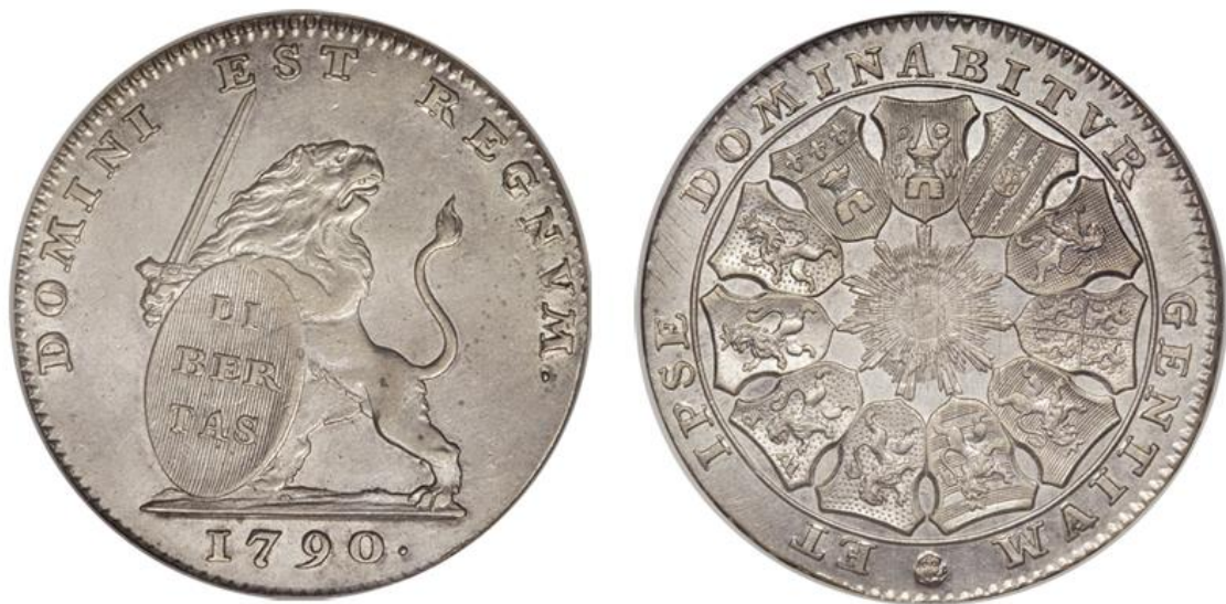
Afb. 6: De “zilveren leeuw”, drie florijnenstuk van de Verenigde Belgische Staten uit 1790.

In België is Van Berckel ook beroemd vanwege een prachtige serie munten die is uitgegeven tijdens de merkwaardige periode in de geschiedenis van België die de Brabantse omwenteling wordt genoemd. De Belgen maakten in 1789/90 een kortstondige revolutie door, waarbij de Oostenrijkse overheersers werden verdreven en de republiek der Verenigde Nederlandse (Belgische) Staten werd uitgeroepen. Binnen een jaar viel de republiek ten prooi aan chaos en kwamen de Oostenrijkers terug. Van Berckel bleef tijdens de revolutie (met toestemming van de Oostenrijkers) op zijn post en maakte een serie munten voor het nieuwe bewind (afb. 6). Dit zijn in feite de eerste munten van België in zijn huidige vorm en daarom zijn ze uitermate geliefd (en dus onbetaalbaar) bij Belgische muntverzamelaars.