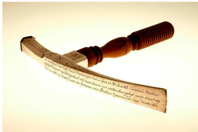
Afb. 3: Zilveren stratenmakerhamer in opdracht van het stadsbestuur gemaakt door Th. Everard van Berckel.

Theodoor Victor van Berckel was een telg uit een oud adellijk geslacht dat sinds de middeleeuwen in 's-Hertogenbosch woonde. Vanaf ca. 1690 verdienden de grootvader en vader van Th. Victor hun brood als zilversmid. De Van Berckels onderhielden nauwe banden met het stadsbestuur en de schepenen bestelden regelmatig, zowel privé als voor de stad, zilveren siervoorwerpen bij de familie. Het Noordbrabants Museum heeft een collectie van dit zilverwerk in permanente expositie.